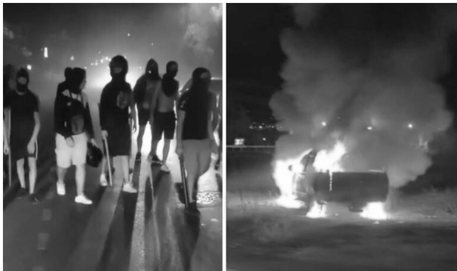
Φωτογραφίες απο την δεύτερη νύχτα του πογκρόμ

διαμαρτυρία των Σύριων. Έκαψαν το αυτοκίνητο ενός ατόμου που μίλησε σαν εκπρόσωπος της Συριακής κοινότητας (ο οποίος απείλησε δημόσια πως θα μπουκ και αυτοί στα σπίτια όσων μπήκαν στα δικά τους), και υπήρξαν συμπλοκές με Σύριους και (κυρίως) με την αστυνομία.